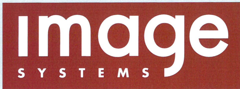
IMAGE SYSTEMS AB SNICKAREGATAN 40, 582 26 LINKÖPING TEL: 013 200 100 INFO@IIMAGESYSTEMS.SE